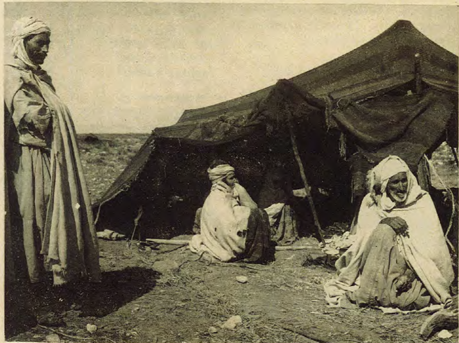
la politique économique du pouvoir aggrave la misère et consolide base économique de la nouvelle bourgeoisie