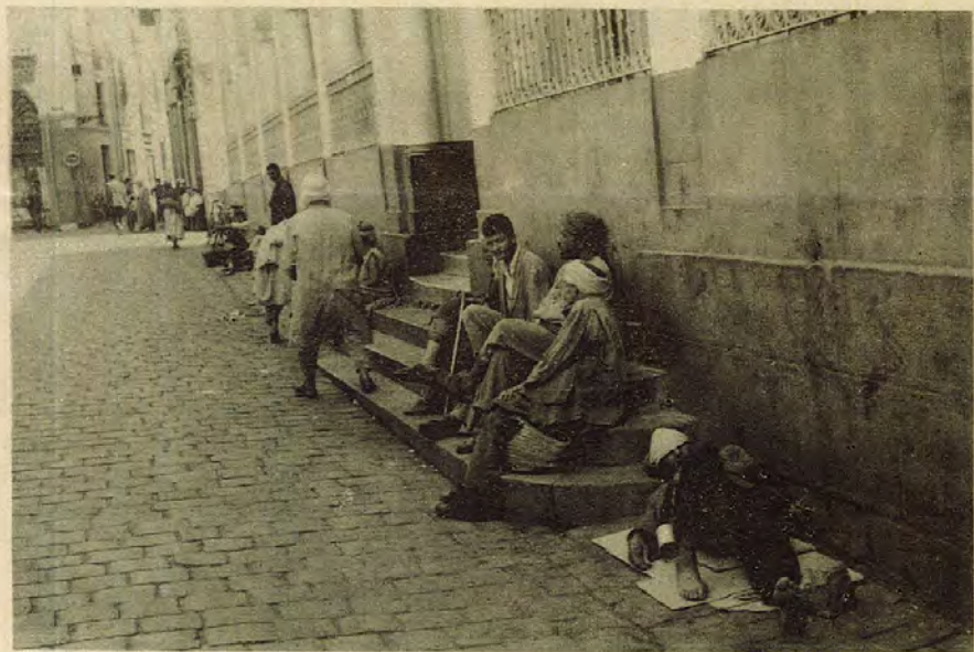
des millions de bras inutiles

La bourgeoisie d'Etat algérienne sert donc de relai aux capitalistes étrangers qui sont, en dernier ressort, les bénéficiaires exclusifs d'une telle politique. Par ailleurs, ces grandes unités industrielles créent peu d'emplois. La CAMEL a demandé une dépense de 42 milliards pour créer 210 emplois. (Capitaux américains, français, etc.)